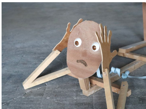
Soulevez la peau, vous verrez la bête #1, Centre d'art Bastille de Grenoble, 2025

Dans le cadre du Chemin de affinités 2026, Lorette Pouillon sera accueillie entre janvier et octobre 2026 pour développer son projet Saut de puce. Elle propose de s'intéresser au paysage comme un assemblage d'éléments dits « naturels » en les personnifiant, et en explorant leur potentiel dramatique. Elle rassemblera dans chaque lieu visité un ensemble de matières, gestes et expériences, qui pourraient permettre de donner une vue d'ensemble sensible des espaces qu'elle a traversés. À partir de ces éléments, et en s'inspirant des arts et techniques de la marionnette, elle souhaite questionner le rapport de domestication à la nature : à la fois construite de toute pièce comme un gigantesque décor de théâtre autant que comme la protagoniste principale sans qui rien ne se raconte.