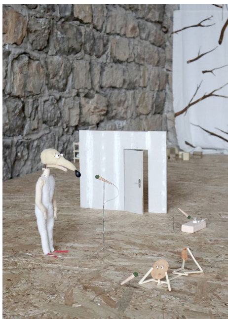
Soulevez la peau, vous verrez la bête #2, Centre d'art Bastille de Grenoble, 2025