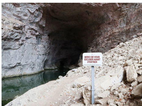
Politesse, résidence à la Villa Glovettes, 2023