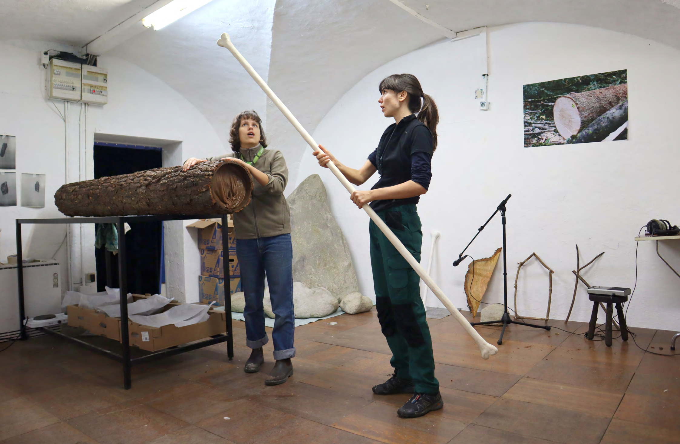
2023 ~ Extrait de la performance. Une performeuse amène un tronc d'arbre, elles l'ouvrent ensemble et en sortent un grand os qu'elles ajoutent à leur collection.