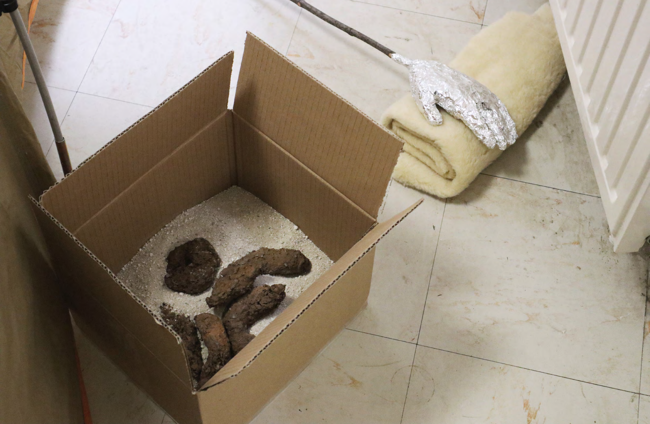
2023 ~ Excréments en caoutchouc dans un carton rempli de sable Main en aluminium reposant sur de la fourrure synthétique