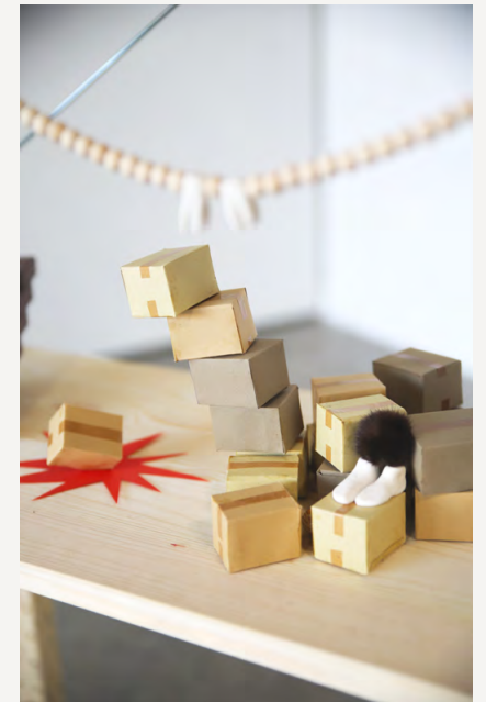
2025 Deux étagères IVAR ~ IKEA Ensemble de pièces miniatures en carton, tissu, bois, plastique, papier, métal.