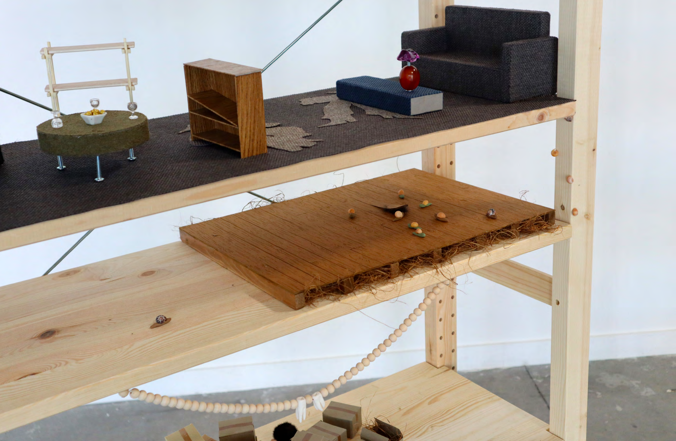
2025 ~ Mobilier de salon en tissu, bois, carton et adhésif Faux plancher en carton peint, escargots miniatures