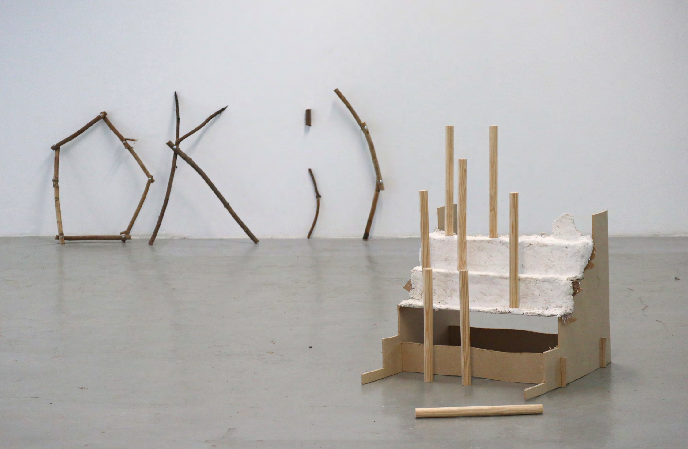
Détails de sculptures réalisées lors d'une résidence au Creux de l'Enfer, activées lors de la performance.