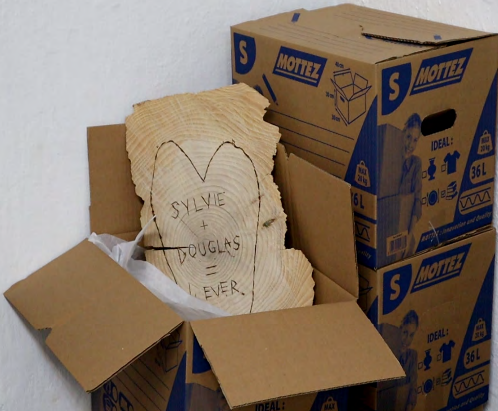
SYLVIE + DOUGLAS = <3 4 EVER 2023 ~ Douglas pyrogravé, cartons