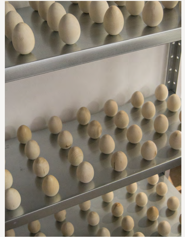
2021 ~ Etagère acier galvanisé, oeufs en bois 72 x 30 x 145 cm